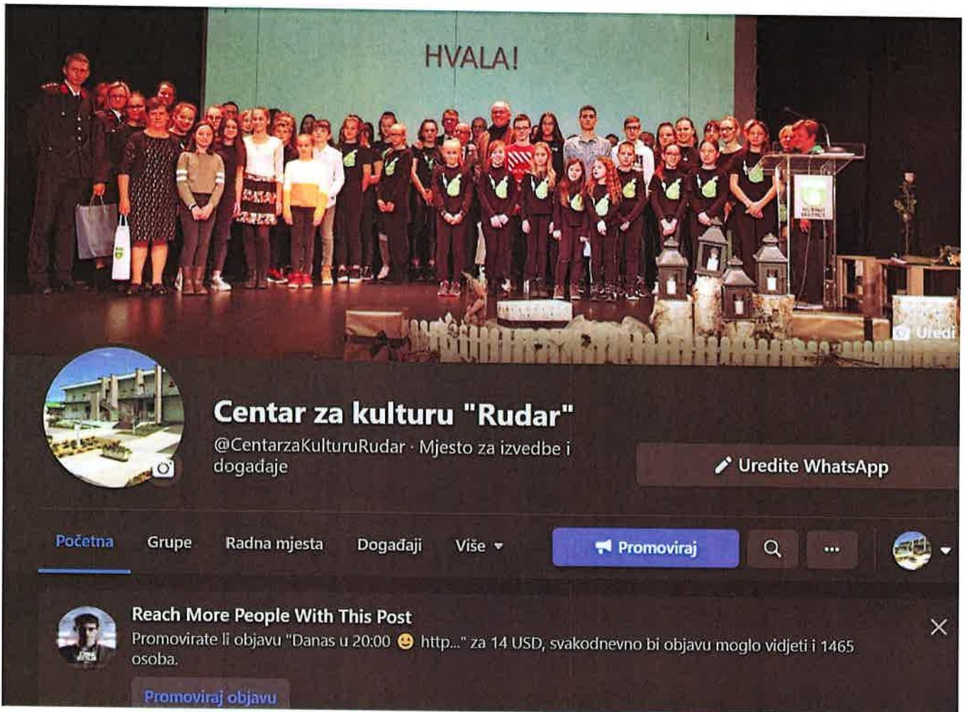
Prilog 2. – Facebook profil CZK Rudar