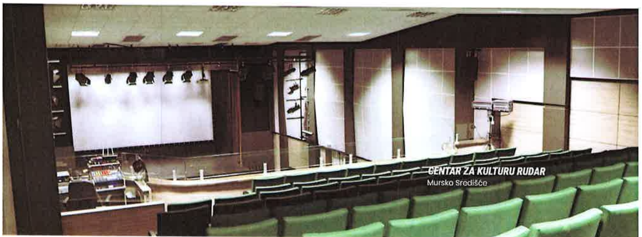
Prilog 1. – Mrežna stranica CZK Rudar

Centar za kulturu Rudar POČETNA AKTUALNO RASPORED PROJEKTI ZANIMLJIVOSTI VIRTUALNA ŠETNJA KONTAKT