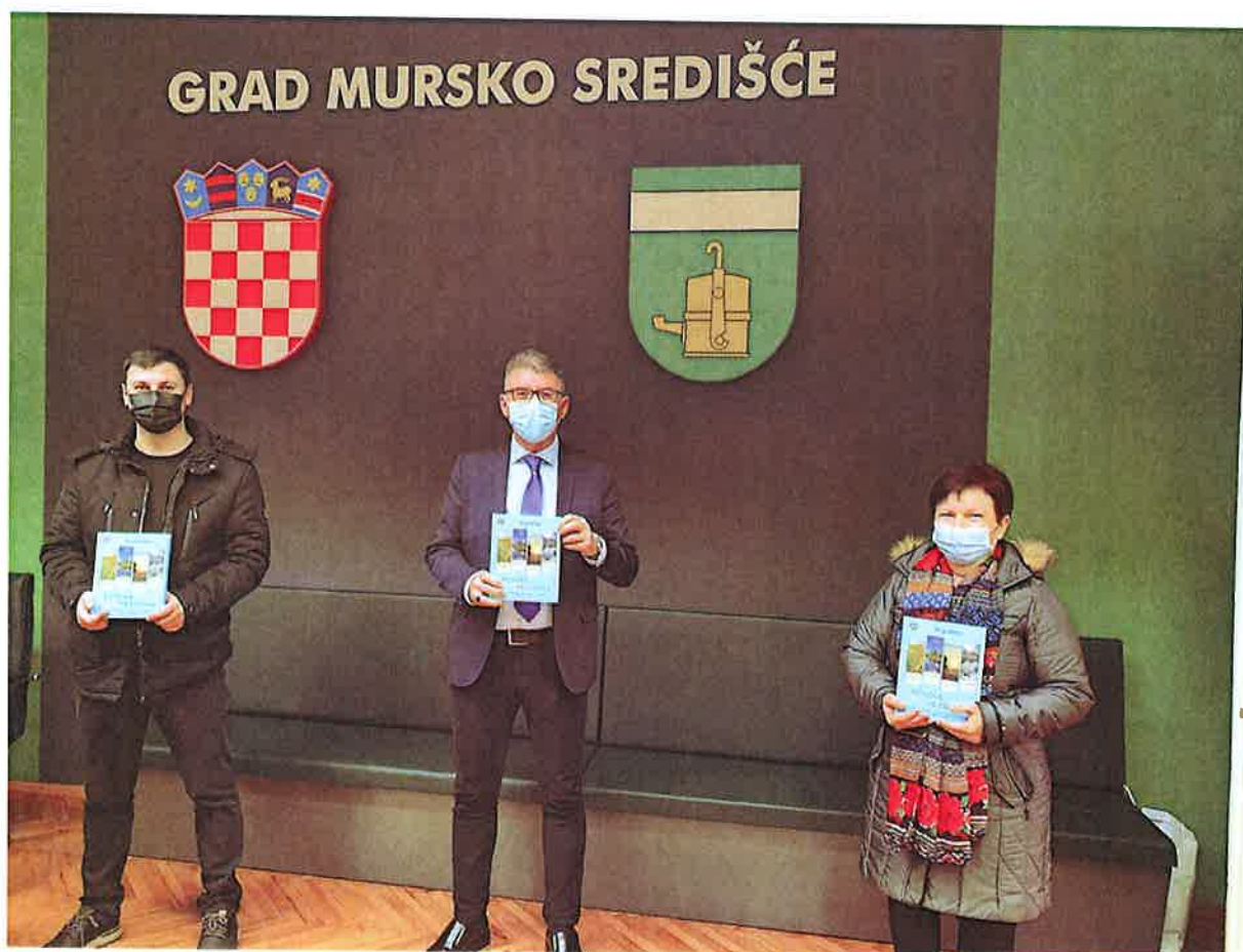
Prilog 9. – Monografija zbora otisnuta je krajem prošle godine, a predavljanje će biti na blagdan sv. Cecilije ove godine, ukoliko epidemiološke mjere dozvole