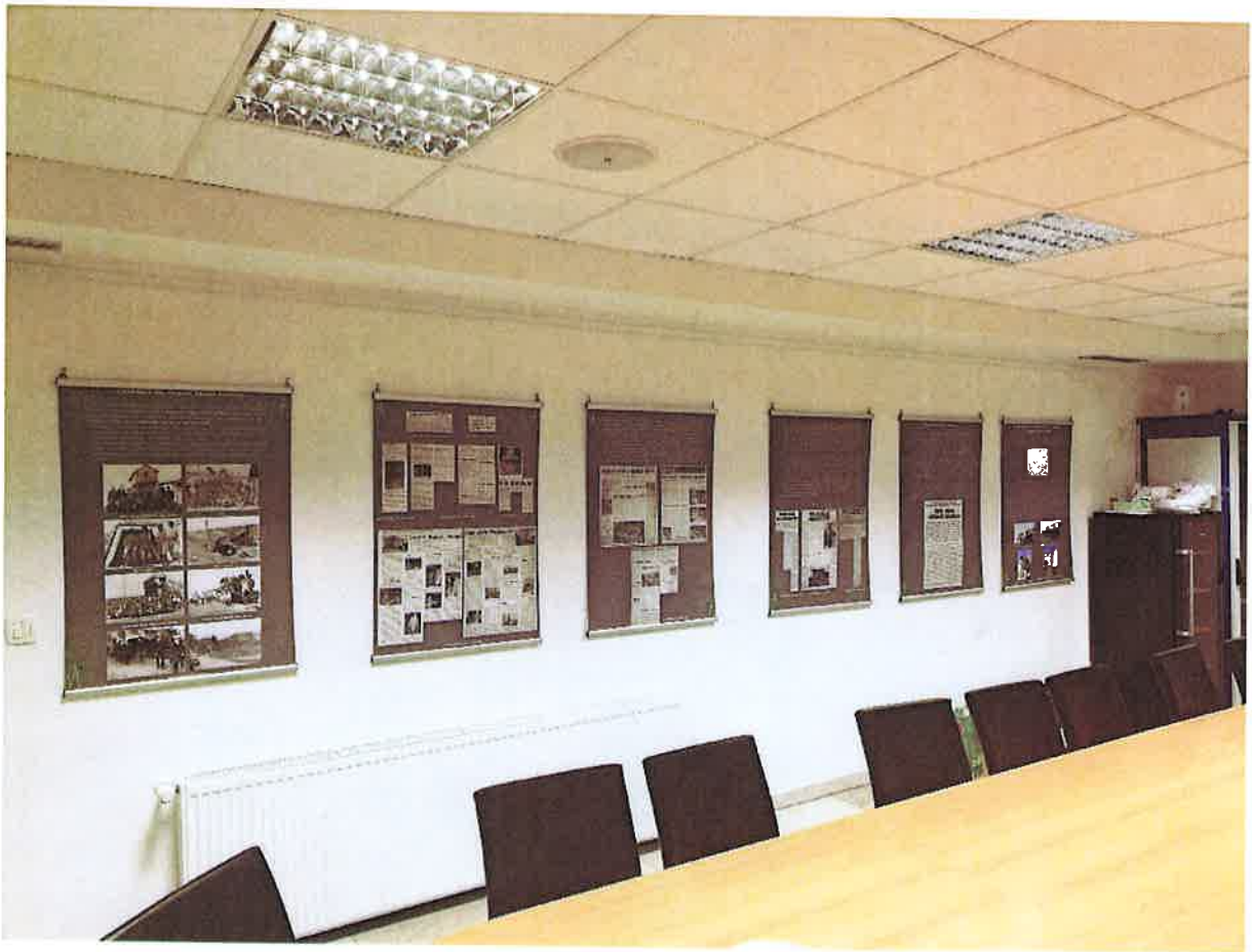
Prilog 10.- Izložbe u CZK Rudar