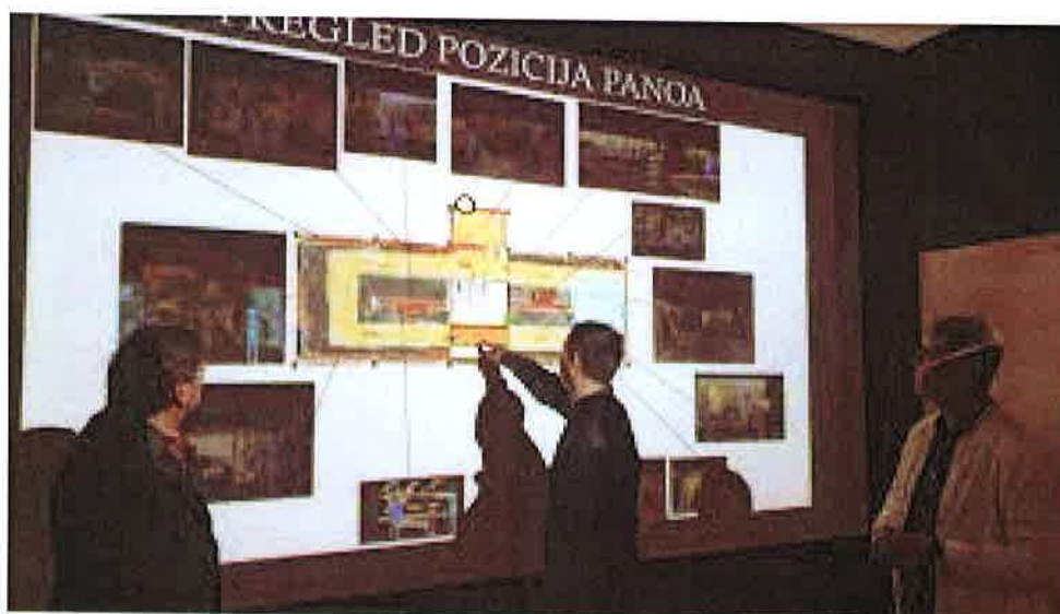
Prilog 7. Djelatnici CZK Rudar uključeni su u kreiranje interpretacijskog centra rudarstva na području Murskog Središća i interpretacijskog parka naftaštva u Peklenici